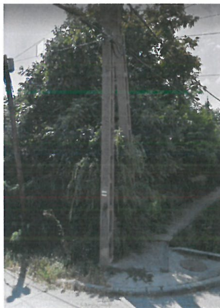
Jelzés az áttörésre merőleges felületen