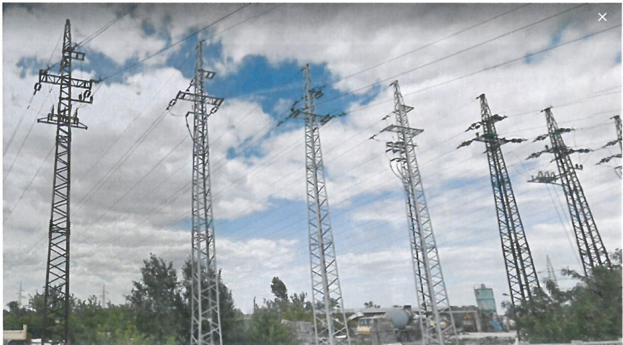
Párhuzamosan haladó KÖF vezetékek

Azokon a helyeken, ahol több KÖF vezeték is halad, ott üzemviteli célú színjelölések lehetnek az oszlopon. A tévesztés megelőzése miatt már üzemviteli színjelöléssel ellátott, vagy párhuzamosan haladó KÖF vezetékek oszlopain turista jelezések felfestése nem megengedett.