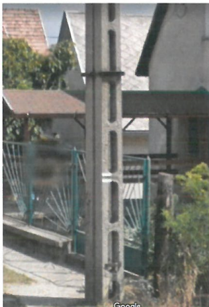
Jelzés az áttörés felőli oldalon