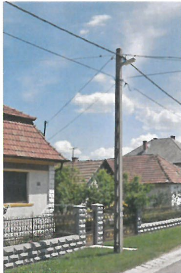
KIF vasbeton oszlop